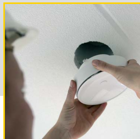
ALS DE WONING GLASDICHT IS KUNNEN IN ÉÉN ARBEIDSGANG DE INSTALLATIE EN DE VENTILATIEVENTIELEN WORDEN GEMONTEERD